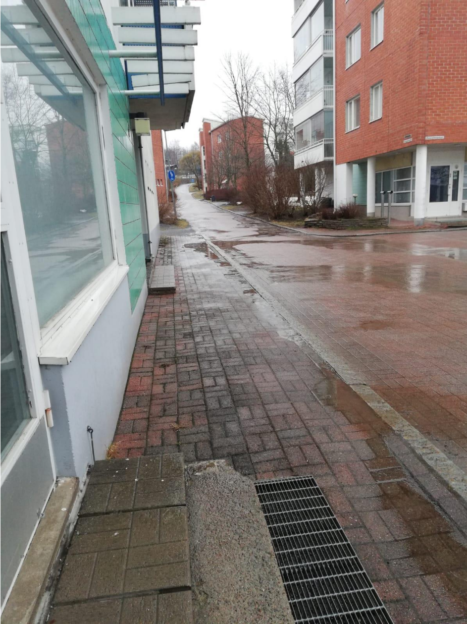
Kuva 1. Sulamis- ja sadevesien pakkautuminen Kraatarinraitille Haapalinnantorille